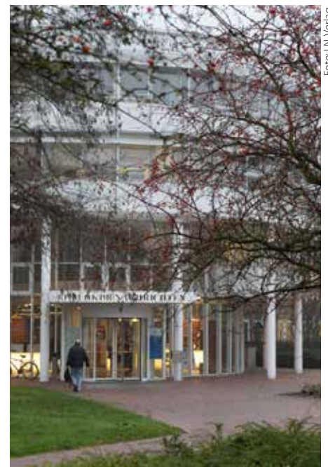
Verlagsgebäude im Lübecker Herrenholz