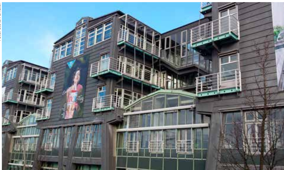
Im Verlagshaus von Gruner + Jahr am Hamburger Baumwall werden rechtssichere Beschäftigungsmodelle gesucht

„Gruner + Jahr tut sich schwer“, titelte die taz vor kurzem. Diese Überschrift über einen Beitrag, der sich mit der Situation der festen freien Mitarbeiter des Medienhauses befasst, trifft die Lage. Wie andere Medienhäuser auch, sucht der Verlag nach rechtssicheren Beschäftigungsmodellen für die bisher festen Freien in den Redaktionen. Nach einer Selbstanzeige der Axel Springer SE und Verlagsdurchsuchungen (u.a. bei Dumont Schauberg) durch den Zoll wollen die Verantwortlichen am Baumwall und anderswo nun handeln. Es zeichnet sich ab, dass man in Zukunft entweder festeinstellen oder auf eine ganz freie Zusammenarbeit setzen will. Sogenannte freie Journalisten, die in den Redaktionen fest eingebunden arbeiten, soll es nicht mehr geben. Etwa 250 Betroffene, die zum Teil schon viele Jahre für G+J arbeiten, haben sich