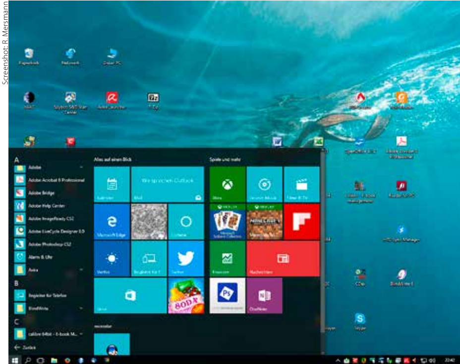
Windows 10 – mit Kacheloptik oder Desktop-Bildschirm

Für Besitzer von PCs und Tablets, auf denen Windows 7 oder 8/8.1 läuft, bietet Microsoft seit Mitte vergangenen Jahres ein kostenloses Update auf Windows 10 an. Wer von dem Angebot noch keinen Gebrauch gemacht hat, sollte sich beeilen. Ab Juli 2016 wird das Upgrade für die ersten Rechner kostenpflichtig.