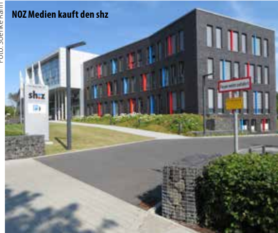
NOZ Medien kauft den shz