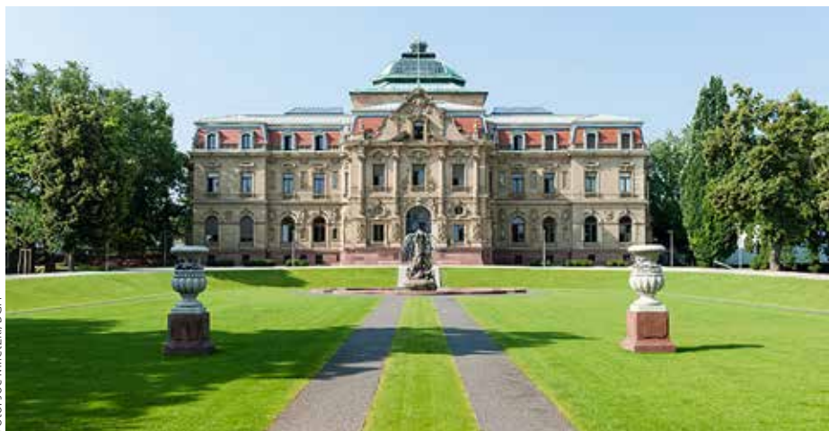
Hauptgebäude des Bundesgerichtshofs in Karlsruhe